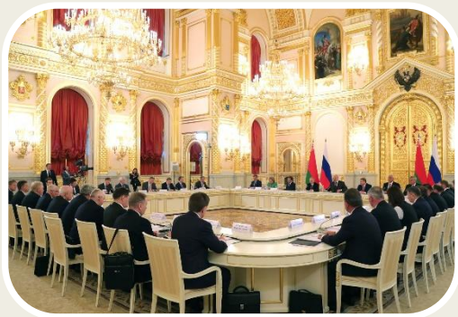
Высший Государственный Совет