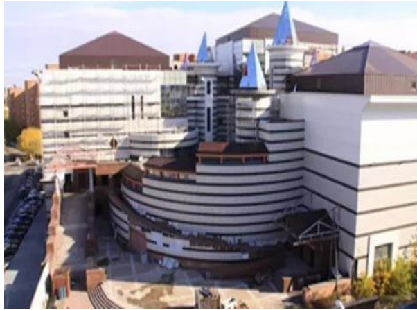
Музейный комплекс им. И.Я. Слоцова