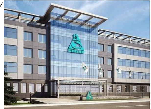
«ООО СИБУР Тобольск»