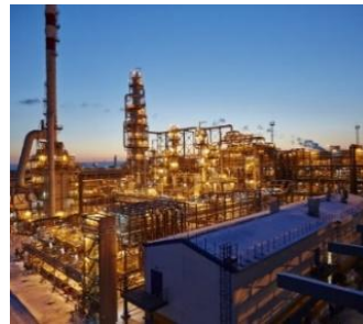
АО «Антипинский нефтеперерабаты вающий завод»