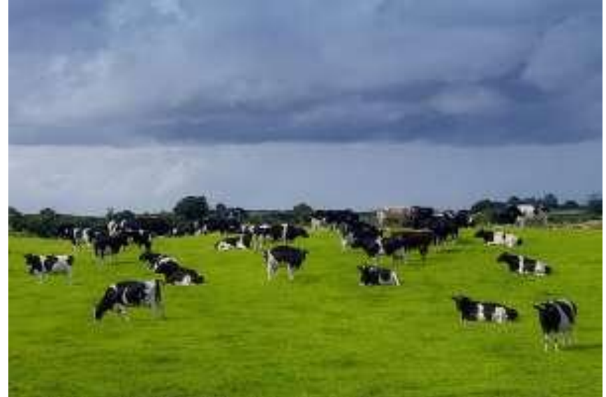
Выпас скота, Англия

Среди злаков важными являются пшеница, овес, рожь. Значительная часть злаков идет на производство хлеба, крупы и т.д. В животноводстве наиболее важными является рогатый скот.