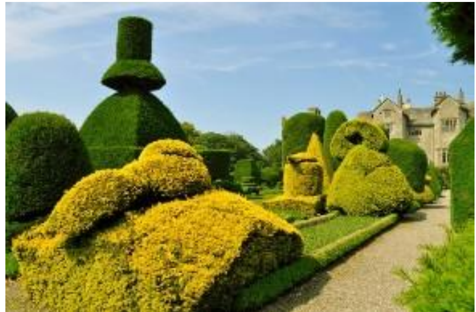
Сад Левенс, Графство Камбрия, Англия

широколиственные породы (дуб, граб, вяз, бук) и лишь в Шотландии – сосна. брызгами. Западное побережье практически лишено растительности из-за воздействия ветров с солеными морскими брызгами.