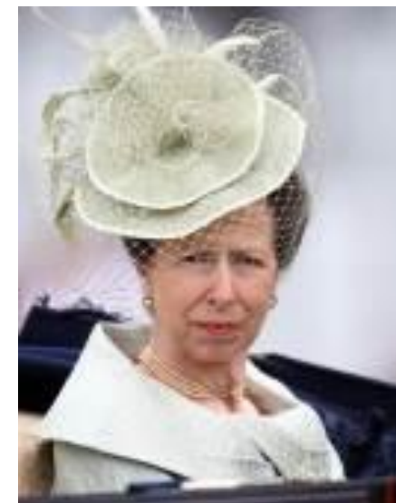
Принцесса Анна, дочь королевы Елизаветы II.