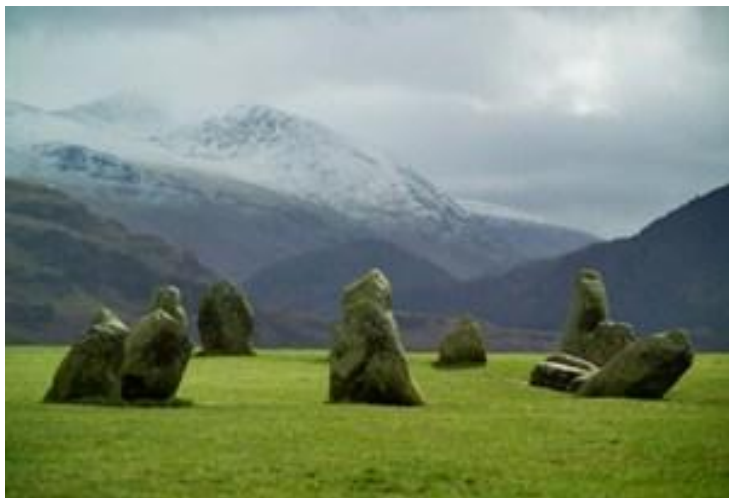
Каслриггское каменное кольцо,