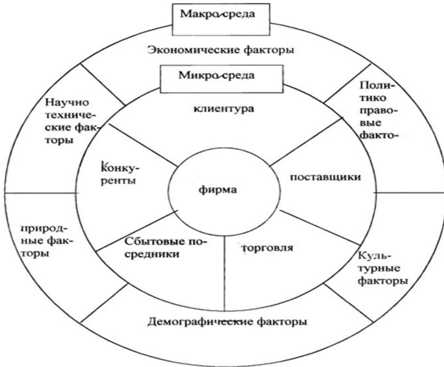
Рисунок - Факторы макро- и микросреды предприятия