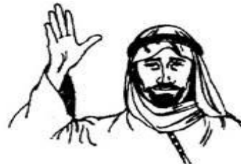
...представители арабской культуры