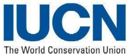
Международный союз охраны природы и природных ресурсов