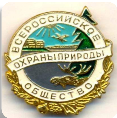
Всероссийское общество охраны природы