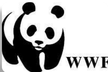
Всемирный фонд охраны природы