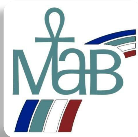
Международная программа ЮНЕСКО «Человек и биосфера».