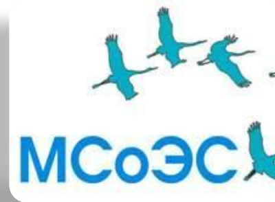
Международный социально – экологический союз