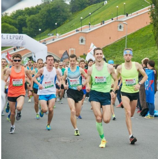
Жители Нижегородской области