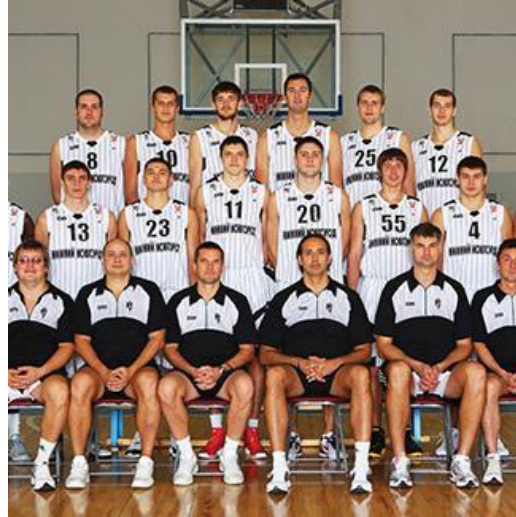
Субъекты физической культуры и спорта Нижегородской области