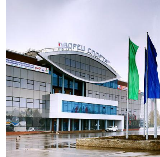
Представители объектов спорта Нижегородской области