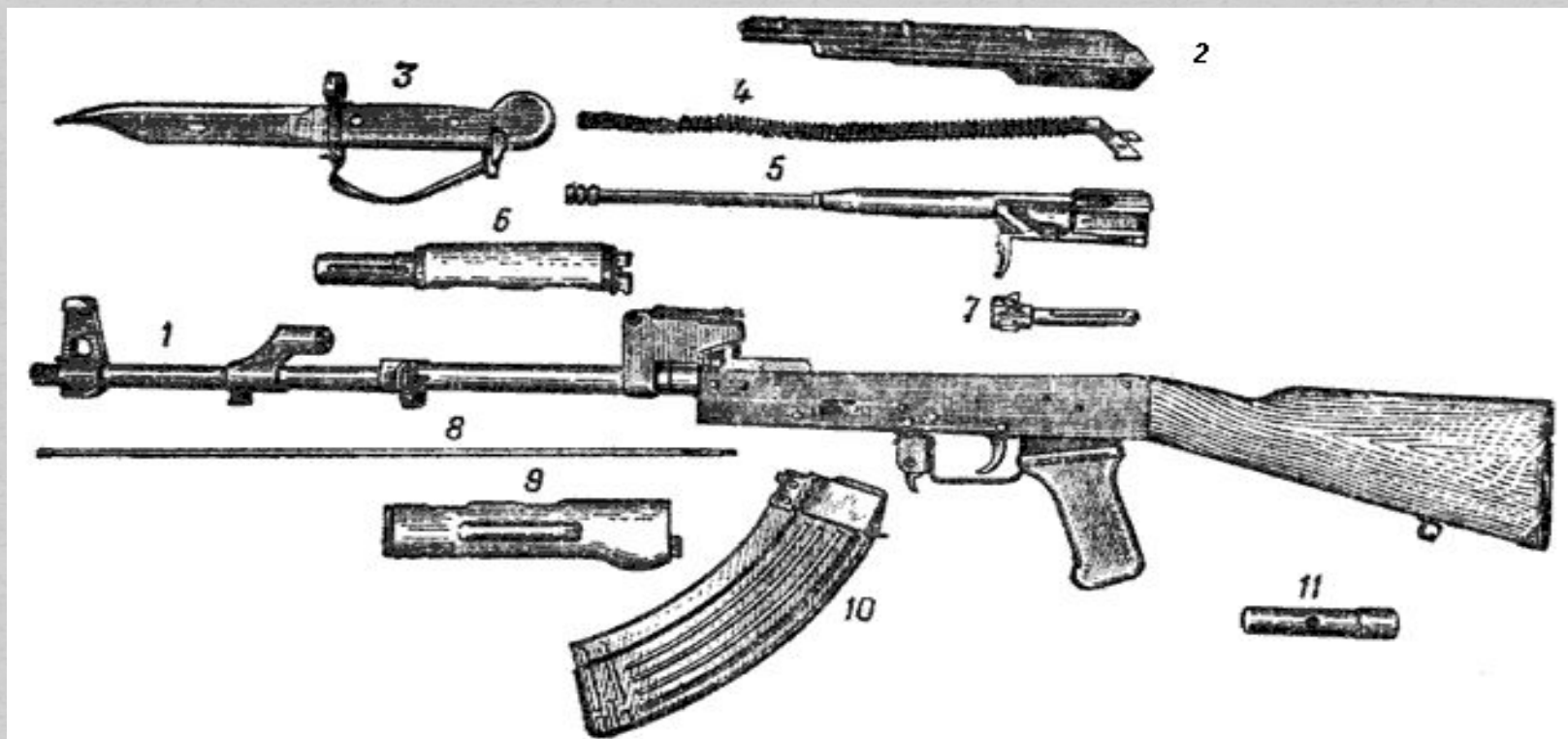
Рис. 2. Основные части и механизмы автомата:

1 — ствол со ствольной коробкой, с прицельным приспособлением и прикладом; 2 — крышка ствольной коробки; 3 — штык-нож; 4 — возвратный механизм; 5 — затворная рама с газовым поршнем; 6 — газовая трубка со ствольной накладкой; 7 — затвор; 8 — шомпол; 9 — цевье; 10 — магазин; 11 — пенал с принадлежностью