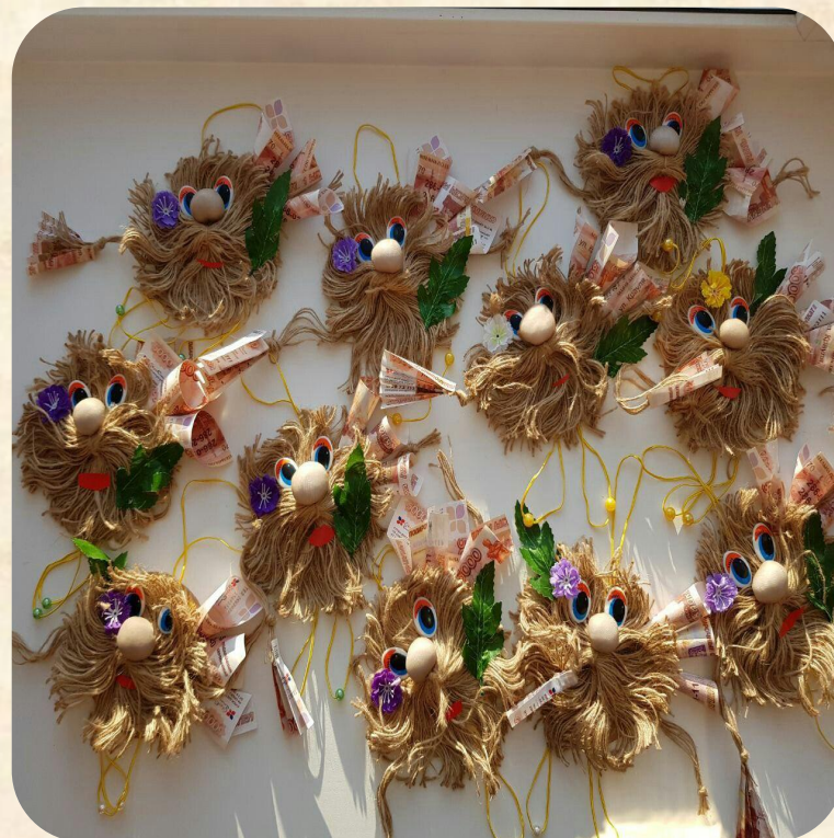
Мастер-класс Делаем подарки родным ко дню Защитника Отечества