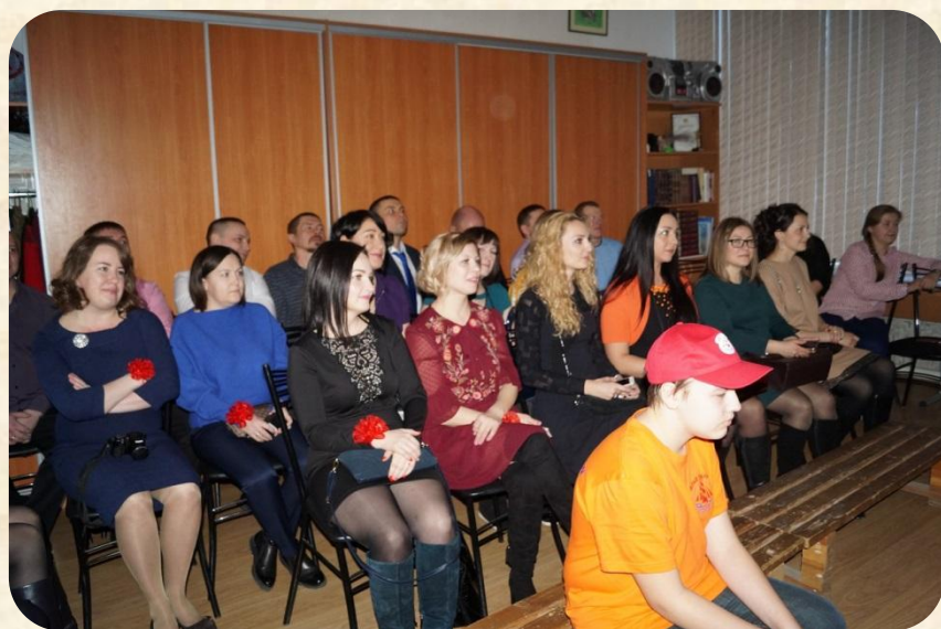
Вечер встречи «20 лет спустя» Выпускники 1998 года