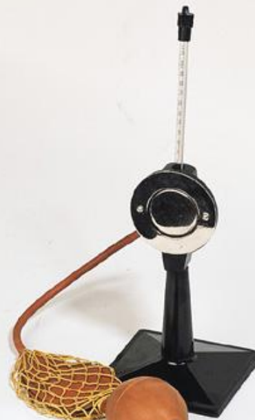
Гигрометр Ламбрехта (конденсационный)