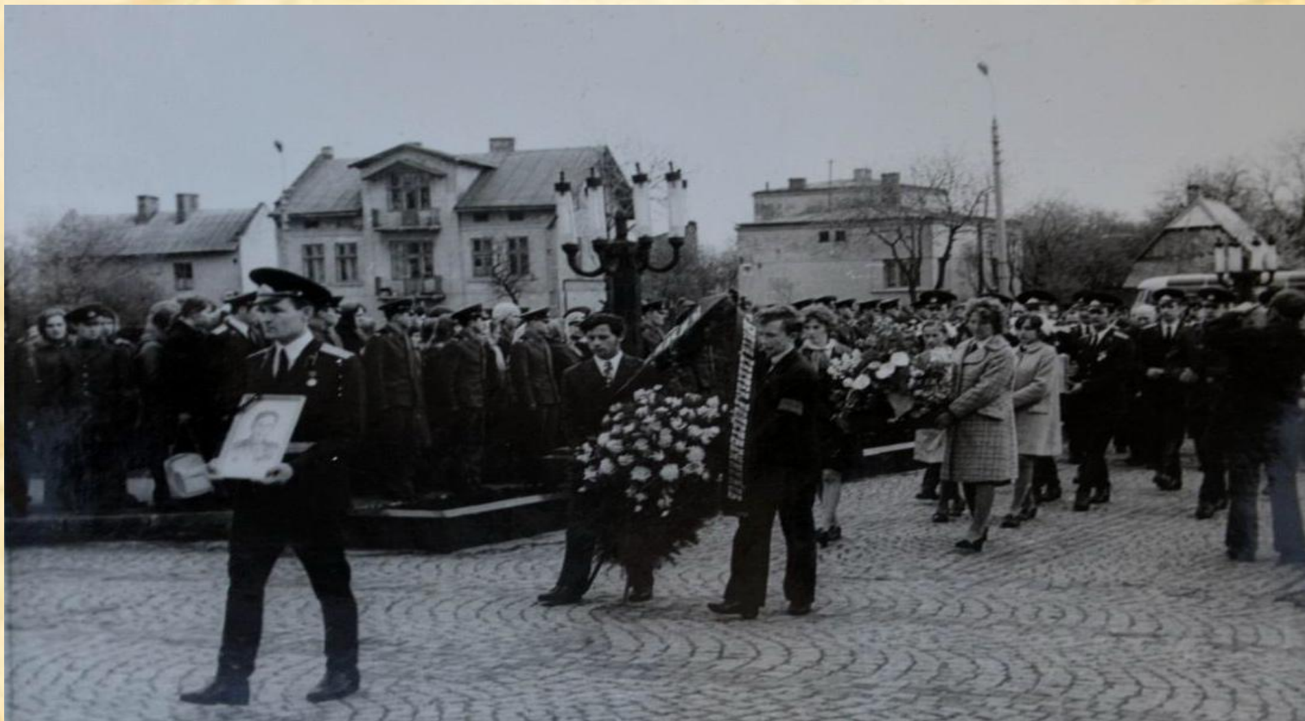
Траурное шествие в момент переноса праха М. С. Лиховида 26 апреля 1975 г.

Первоначально был похоронен в городе Рава - Русская. После войны останки были перезахоронены на холме Славы во Львове.