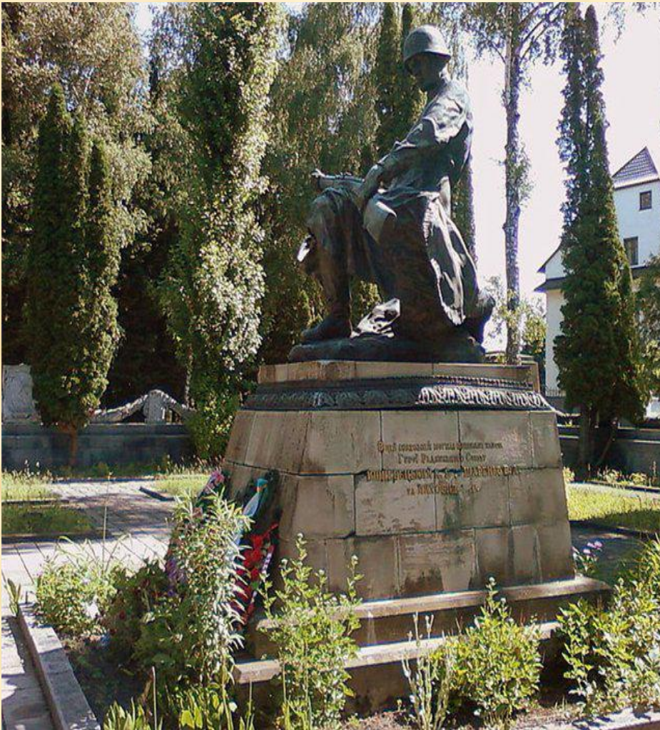
Памятник на могиле Героя Советского Союза Лиховида Михаила Степановича. Холм Славы (Львов, Украина)