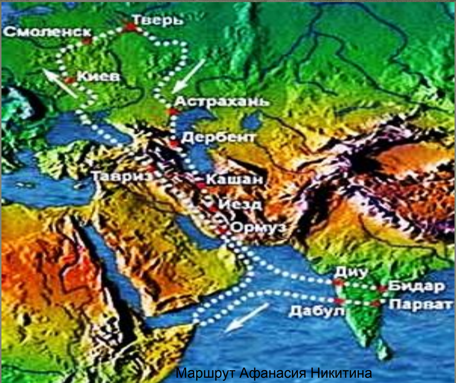
Маршрут Афанасия Никитина