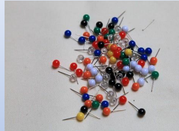
Булавки и иголки