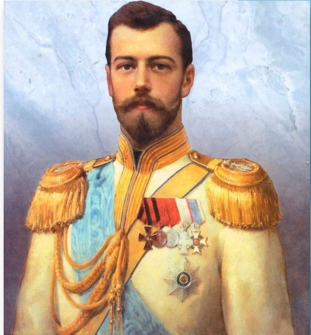
Імператор Микола Перший

І пізніше, за його ж пропозицією, імператор Микола із спадкоємцем престолу «оглядав у подробицях» єврейські школи та лікарні. У підсумку плани Воронцова вдалися, і в Одесу стала переїжджати австрійська єврейська інтелігенція і великі негоціанти з солідними капіталами. Вони купують нерухому власність, відкривають торгові дома. Єврейські фірми робили в місті мільйонні обороти.