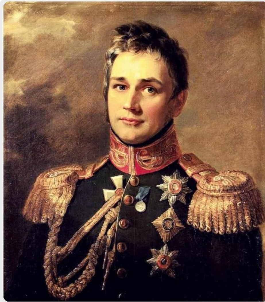
Князь Михайло Семенович Воронцов

Князь Михайло Семенович Воронцов (1823–1854 рр.), Генерал-губернатор Новоросійського краю і Бессарабії, привертає до Одеси аристократів і багатих людей з усієї Росії. Одеса перетворюється на головне торговельне місто півдня Росії, і є одним з її найбільших промислових центрів.