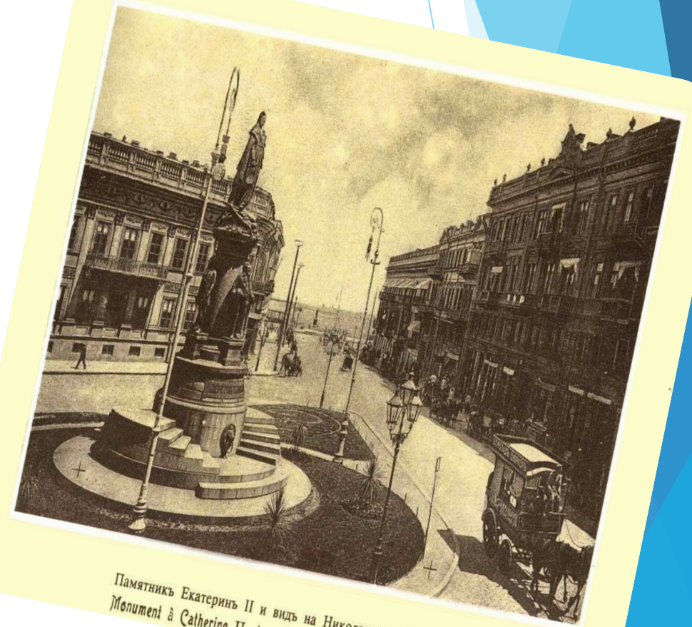
Пам'ятник Єкатеринь II и видь на Николаевскій бульварь. Monument à Catherine II et vue sur le boulevard Nikolaéusky.