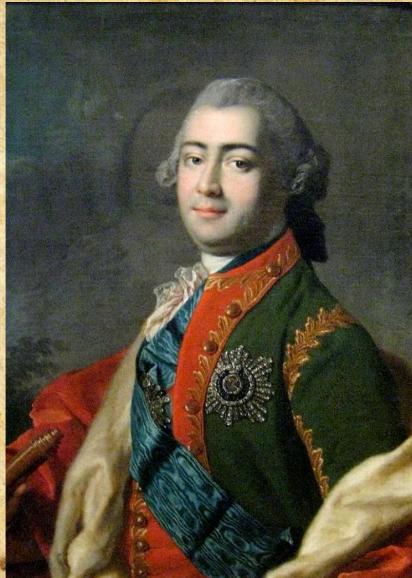
Алексей Григорьевич Разумовский

25 января 1755 год – открытие Московского университета