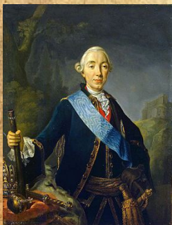
Карл Петр Улирих умерла в 1728 году