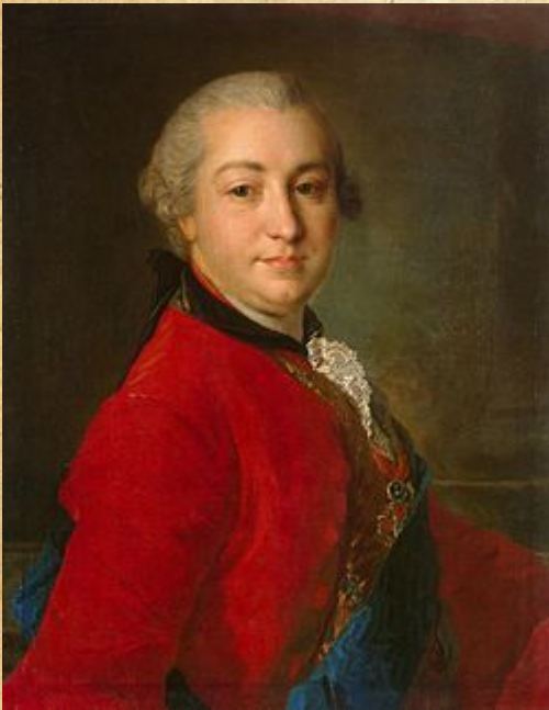
Иван Иванович Шувалов

25 января 1755 год – открытие Московского университета