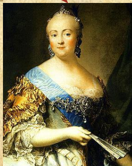
Елизавета Петровна бездетна