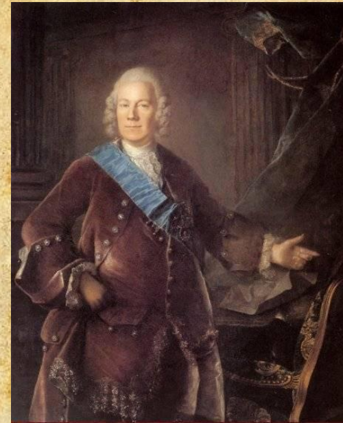
Алексей Петрович Бестужев-Рюмин

1754 год – отмена таможенных пошлин Открытие первого Дворянского банка