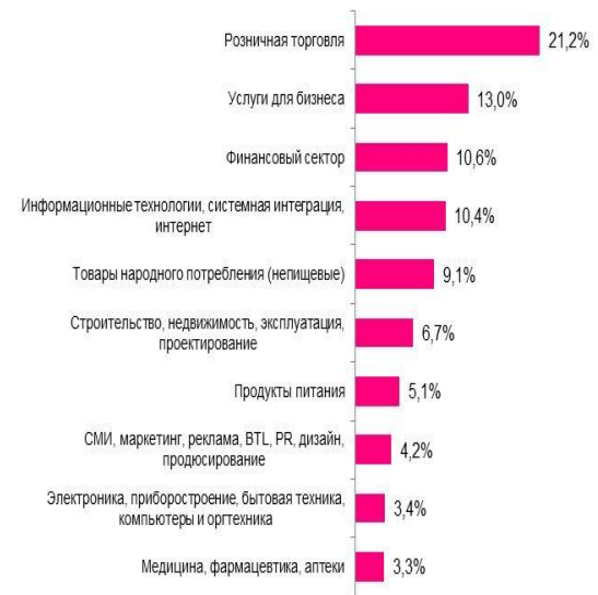
Какие компании размещали вакансии в I квартале 2015 в России? топ-10 (в % от общего количества вакансий, без "другого")