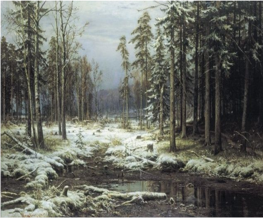
Перший сніг(1875), Шишкін