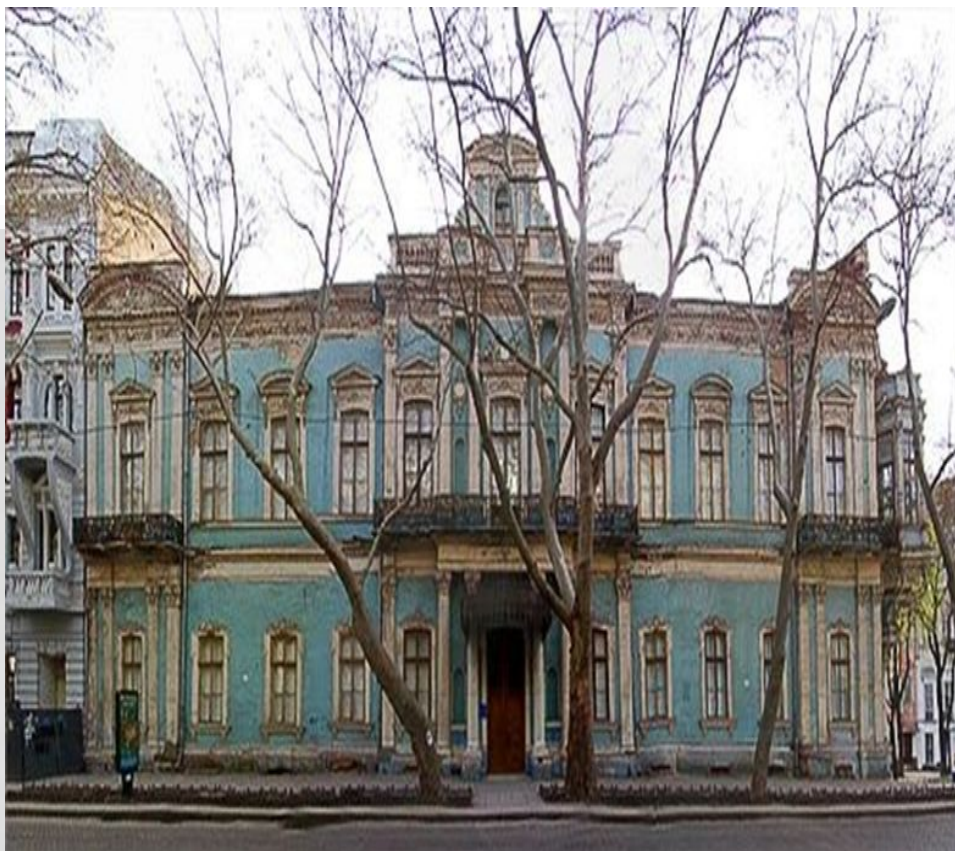
Музей імені Богдана і Варвари Ханенків.