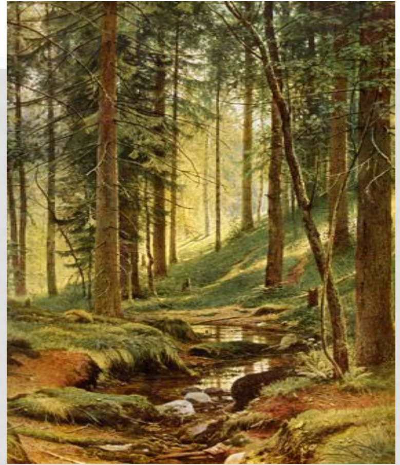
Струмок у лісі(1882), Шишикін