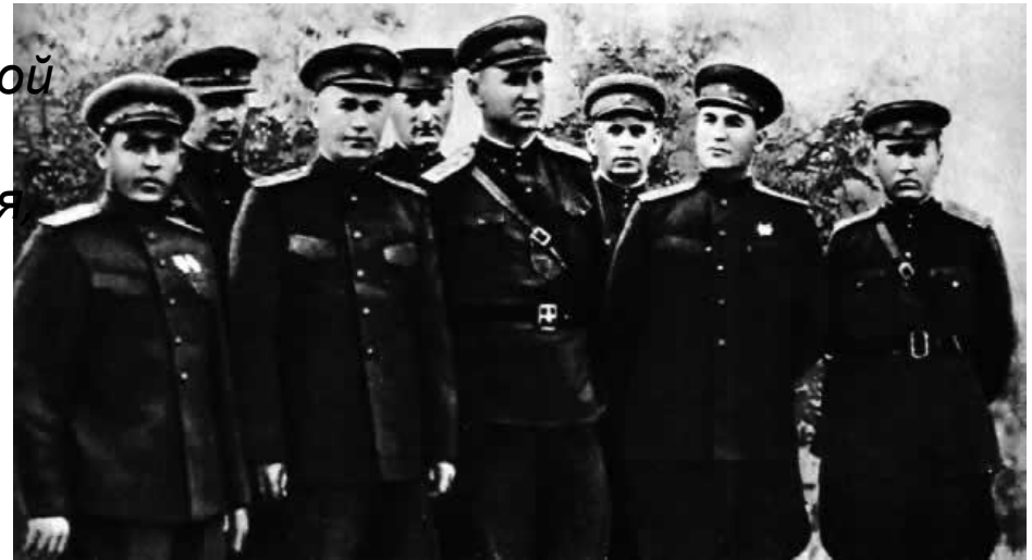
Командующий группой А. А. Гречкин и начальник политотдела 18-й десантной армии Л. И. Брежнев на наблюдательном пункте. Малая земля, весна.