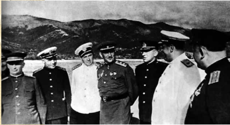
Командующий Северо-Кавказским фронтом И. Е. Петров среди адмиралов, генералов и офицеров. Район Новороссийска, весна 1943 г.