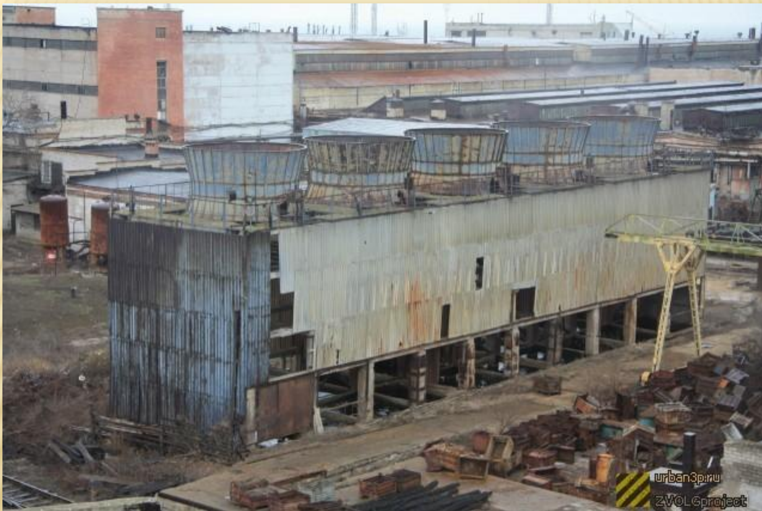
Сталинградский (Волгоградский) тракторный завод