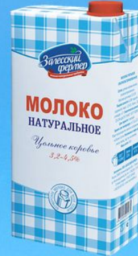
Молоко цельное натуральное