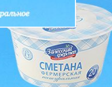
Сметана натуральная 20%