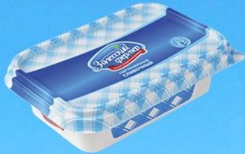
Сыр плавленый сливочный