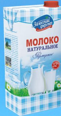
Молоко фермерское натуральное