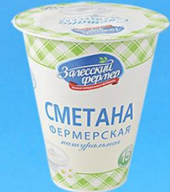
Сметана натуральная 15%