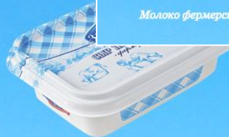
Сыр плавленый фермерский