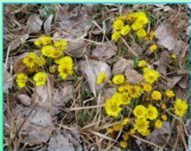
Мать - и - мачеха обыкновенная