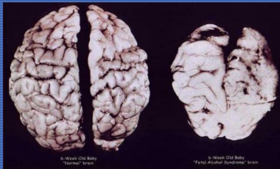
6-Week Old Baby "Normal" brain