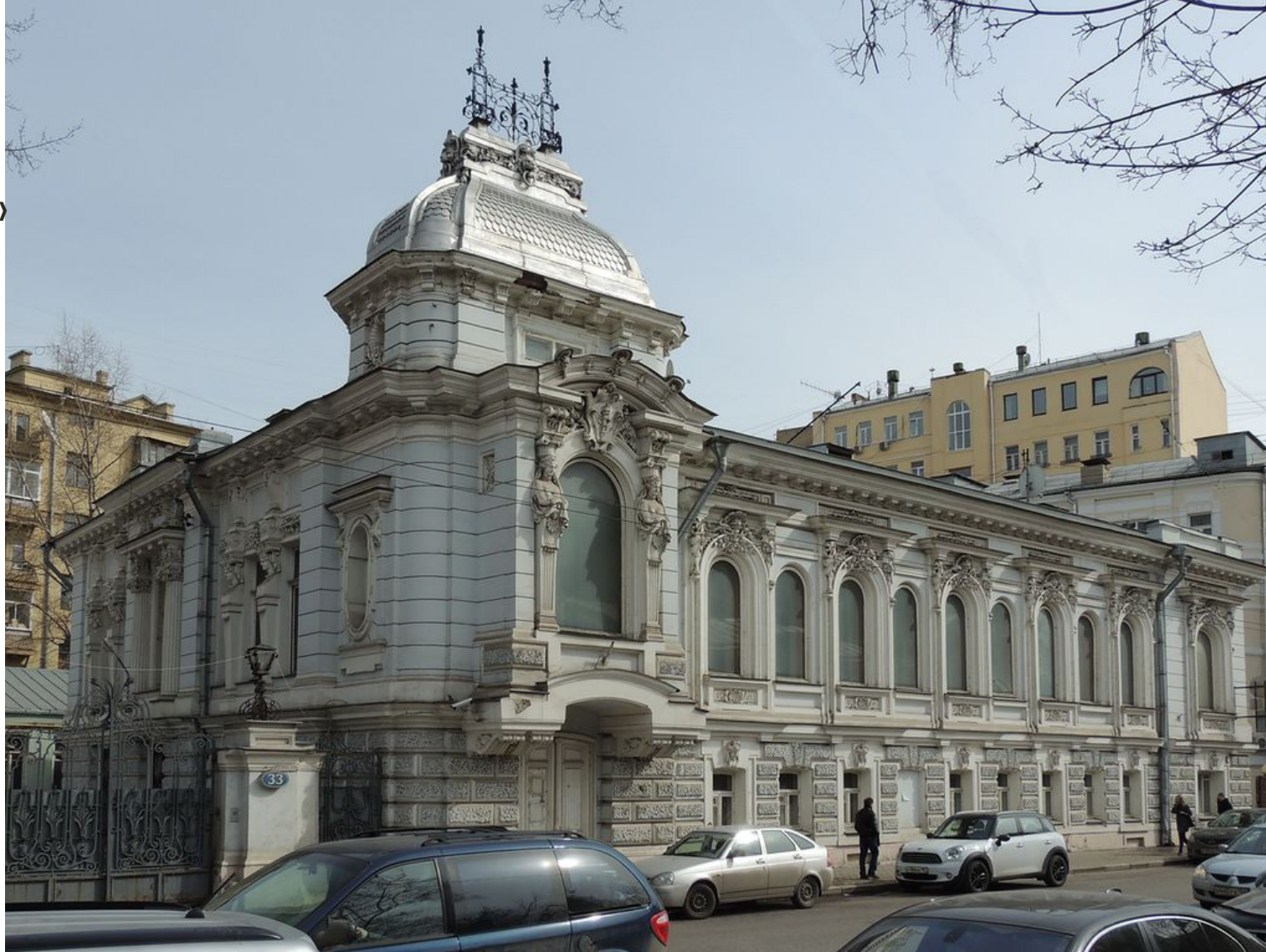
Рис. 10 До реставрации

Особняк Коробковой был заложен в 1866 году. Он был полностью перестроен Кекушевым в 1894 году. В 1930-х годах в особняке на Пятницкой жили несколько президентов Академии наук СССР, в послевоенные годы в здании уже расположился Институт истории искусств АН СССР.