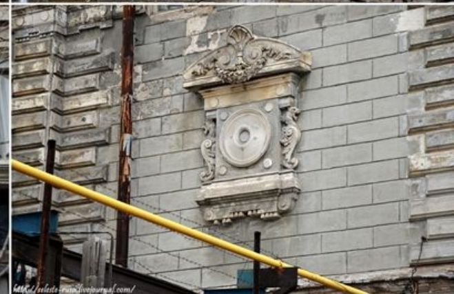
Рис. 21-22 элементы фасада осоньяка Субботина-Шихобалова