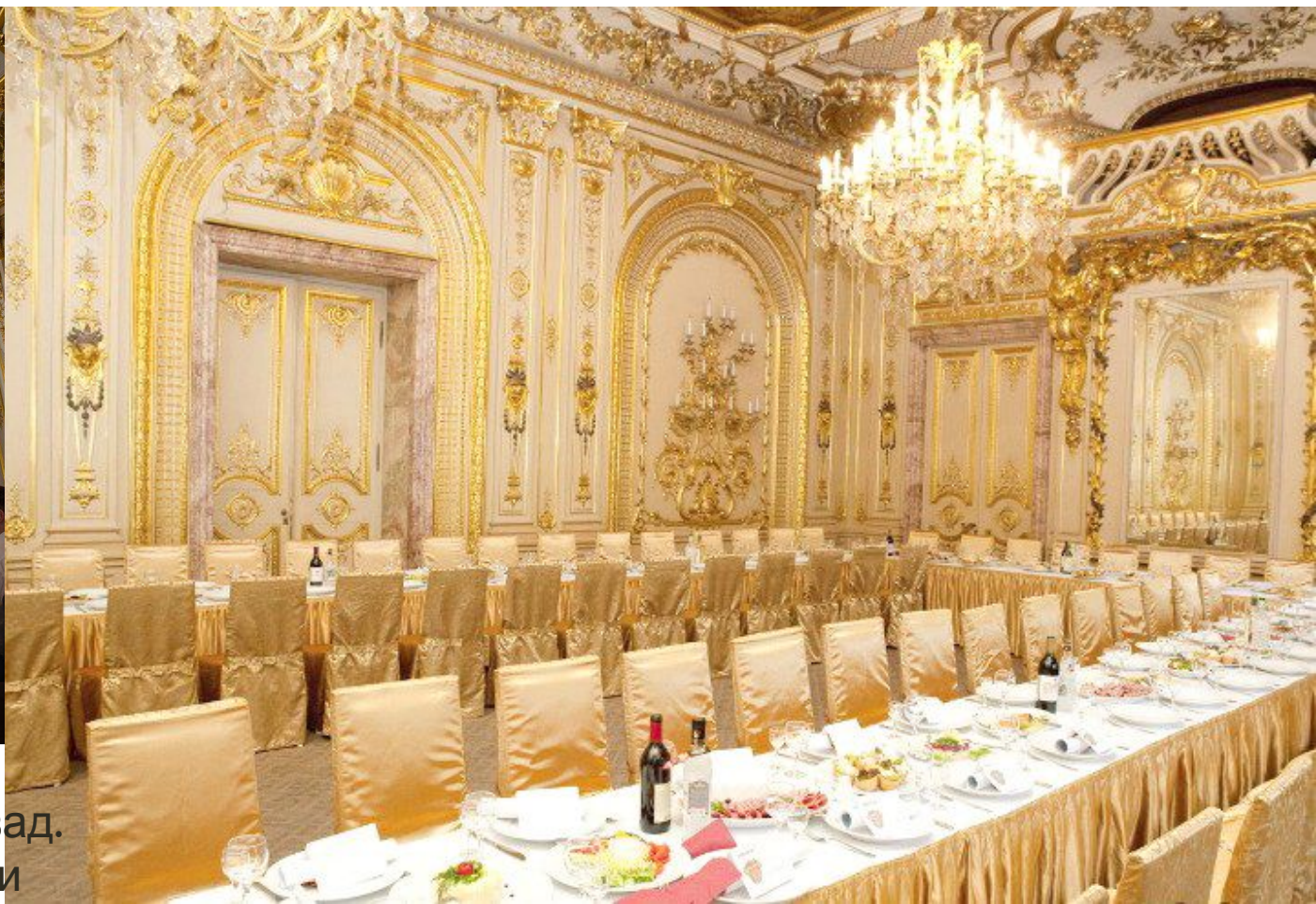
Рис. 13-14 Белый зал особняка

Реставрация особняка началась несколько лет назад. В первую очередь устранили последствия просадки 300-летнего здания