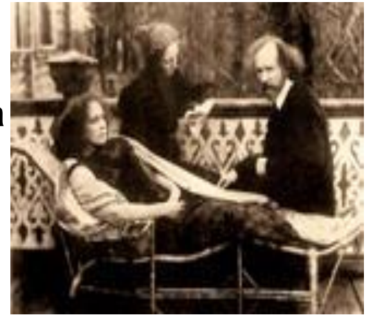
Иванов Вячеслав Иванович и Лидия Дмитриевна, В «Башне» Вячеслава Иванова — литературном салоне, действовавшем в 1905—1909 годах в Санкт-Петербурге на Таврической улице