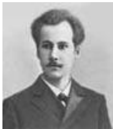
Андрей Белый 1880-1934