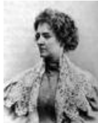
Гиппиус Зинаида Николаевна 1869-1945