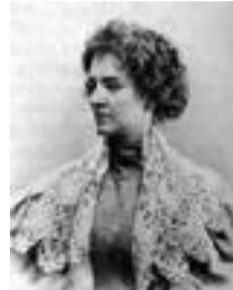
Гиппиус Зинаида Николаевна 1869-1945