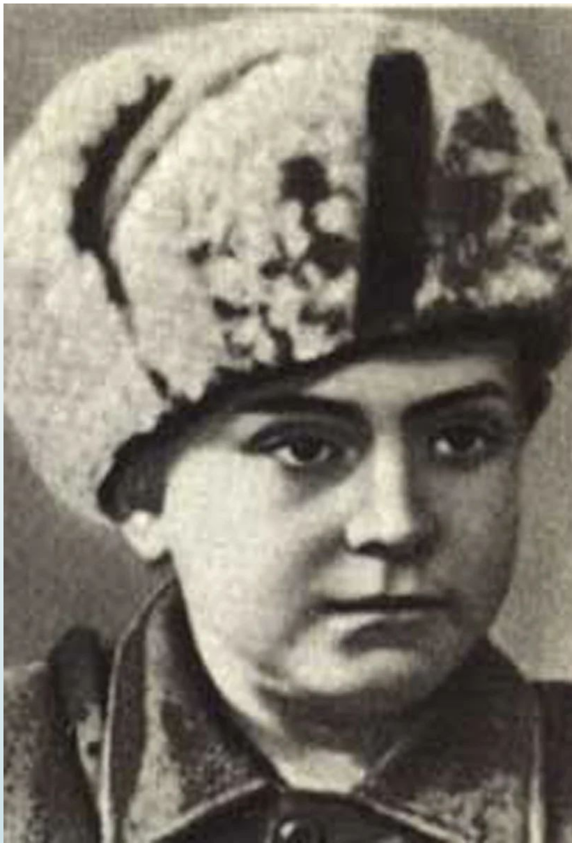
ГОЛИКОВ ЛЕОНИД АЛЕКСАНДРОВИЧ, ЗВАНИЕ ГЕРОЯ СОВЕТСКОГО СОЮЗА С ВРУЧЕНИЕМ ОРДЕНА ЛЕНИНА И МЕДАЛИ «ЗОЛОТАЯ ЗВЕЗДА»