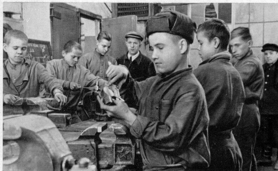
Ученики ремесленного училища № 25 на автозаводе

Беспримерным в истории Великой Отечественной войны был массовый трудовой подвиг детей, подростков, юношей и девушек, который заключался в оказании всесторонней помощи фронту, нашей Родине, находившейся в опасности