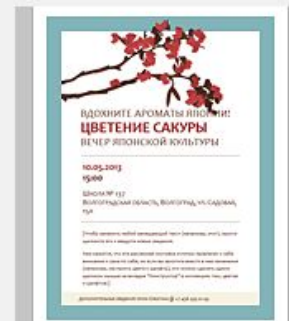
Листовка о мероприя... →