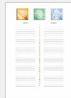
Календарь дней ро...