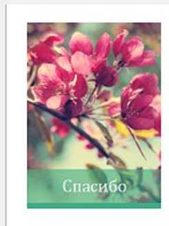
Открытка с благодарн...