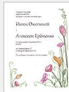
Приглашение на с...