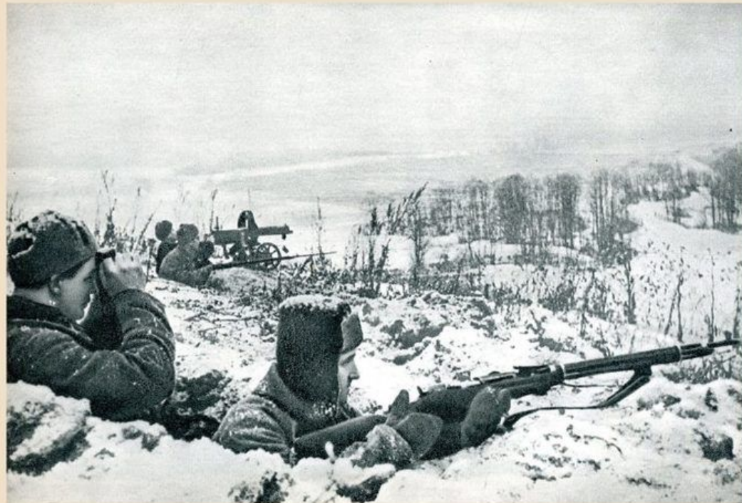
Оборона Москвы. Декабрь 1941 года.