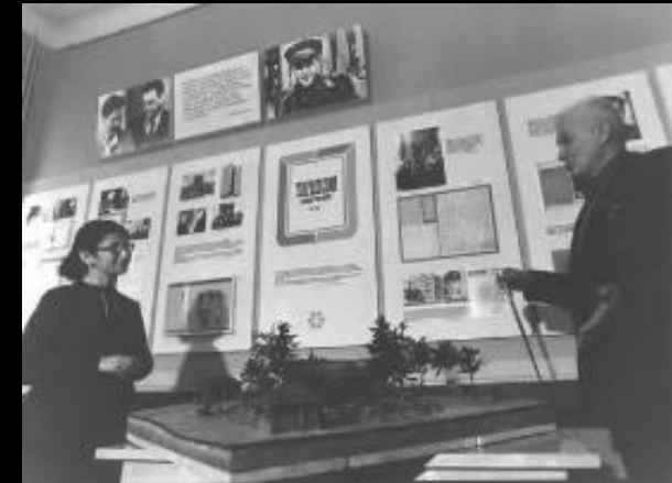
Хутор Загорье, музей А.Т. Твардовского

В 1988 году открыт для посетителей возрожденный хутор Загорье, место, где родился и жил до восемнадцатилетнего возраста А. Т. Твардовский – выдающийся советский поэт. По макету брата поэта Ивана Трифоновича были заново возведены: дом, сарай, баня, кузница и другие надворные постройки, разбит сад и огород. Представленная в интерьере дома мебель тоже выполнена руками брата поэта - мастера – краснодеревщика. Большую помощь в оформлении дома, хозяйственных помещений, кузницы оказали жители деревень, передавшие музею предметы - быта, характерные для того времени. Неброская русская природа и обстановка, окружавшая мальчика, позволяют проникнуться атмосферой, в которой зарождался талант будущего поэта. Ежегодно, в день рождения поэта, на хуторе Загорье проводятся литературные праздники.