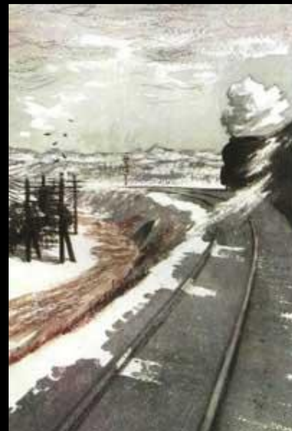
Иллюстрация к поэме «За далью -даль».

Поэма является исповедью современника, прошедшего вместе с народом путь испытаний и побед