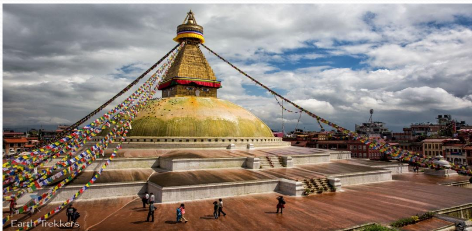
Сингха Дурбар алаңы