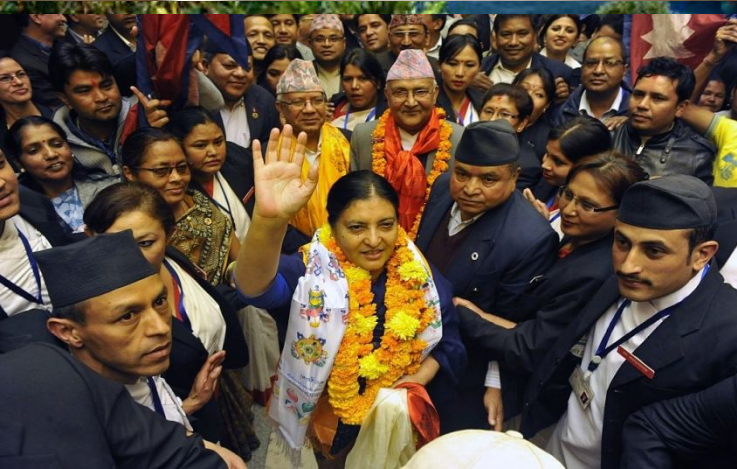
Бидхья Деви Бхандари Непалда алгашқы депутат әйел