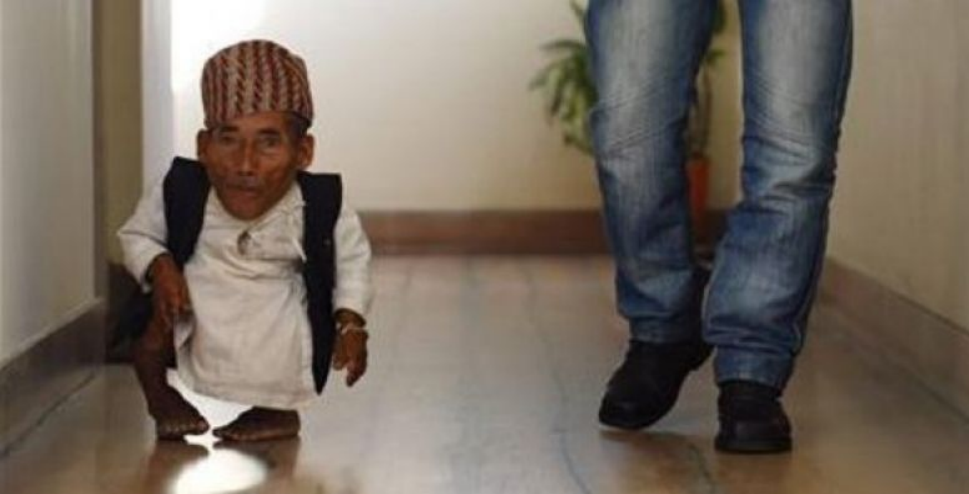
Чандра Бахадур Данги Ең аласа бойлы адам