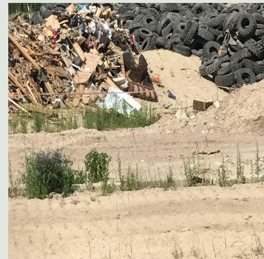
Площадка под строительство МСК