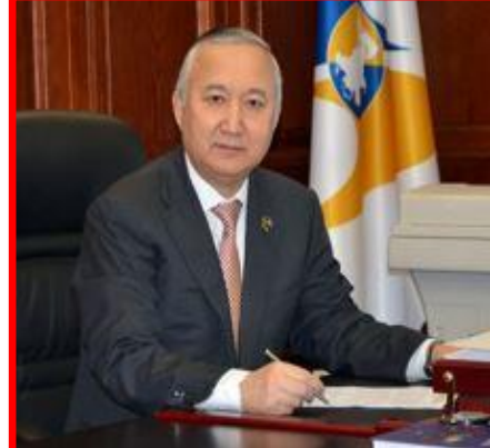
Баишев Ж.Н. Председатель Суда