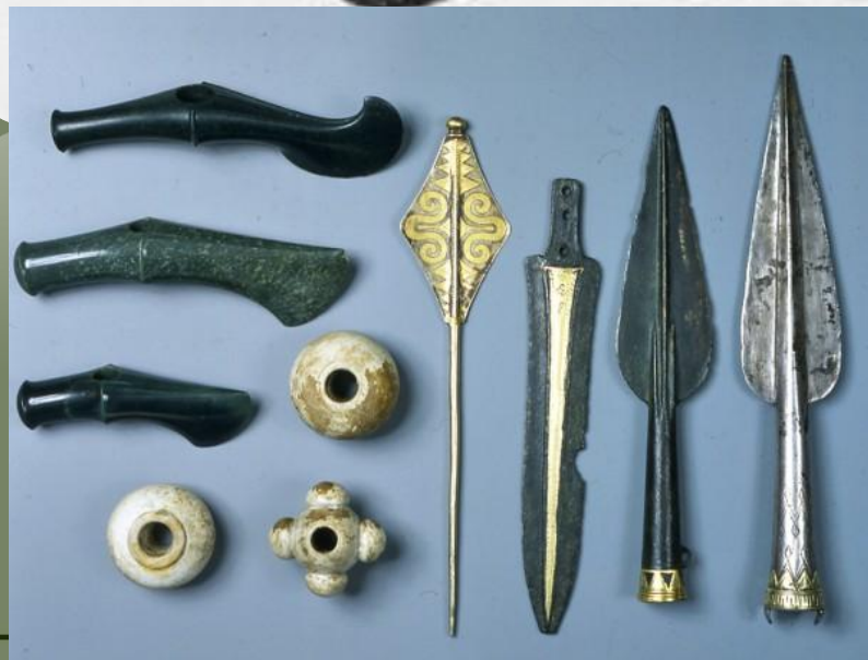
Оружие Бронзового века