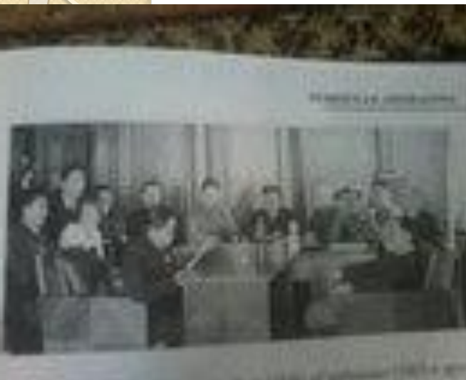
Союз писателей Тувы [4.1]

На сегодняшний день в Туве есть 167 писателей.