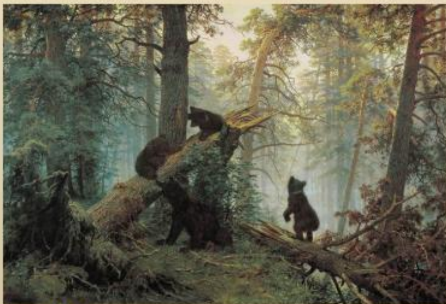
«Утро в сосновом лесу»