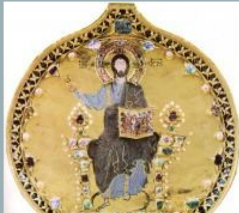
Миниатюра с изображением Христа Изготавливали в Византии и ювелирные украшения.