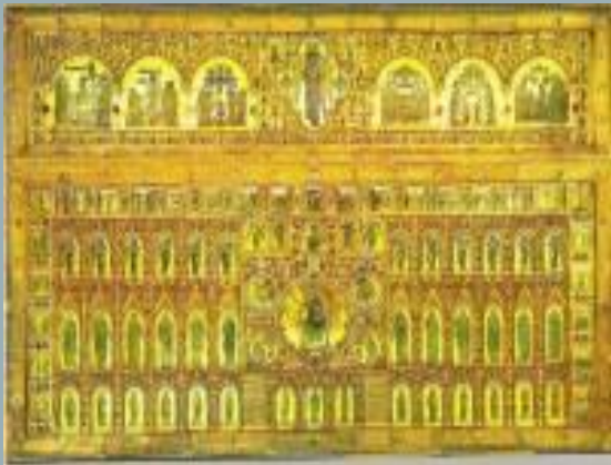
Пала д'Оро Иконостас содержит множество миниатюр.

Были развиты резное дело, обработка металлов, из которых исполнялись выбивные или литые рельефные произведения. Существовал и ещё один вид работ ( agetina ): на медной поверхности дверей или других плоскостей делался лишь слегка углублённый контур, который выкладывался другим металлом, серебром или золотом. Так выполнены двери римской базилики Сан-Паоло-фуори-ле-Мура, погибшие во время пожара в 1823 г., двери в соборах Амальфи и Салерно близ Неаполя. Особенно искусны были византийские мастера в эмальерных изделиях, которые можно разделить на два сорта: простую эмаль и перегородочную эмаль. В первой на поверхности металла делались с помощью резца углубления соответственно рисунку, и в эти углубления насыпался порошок цветного стекловидного вещества, которое потом сплавлялось на огне и приставало прочно к металлу; во второй рисунок на металле обозначался приклеенной к нему проволокой, и пространства между получившихся перегородок заполнялись стекловидным веществом, получавшим потом гладкую поверхность и прикреплявшимся к металлу вместе с проволокой посредством плавления. Образцом византийского эмальерного дела является знаменитая Pala d'oro (золотой алтарь).