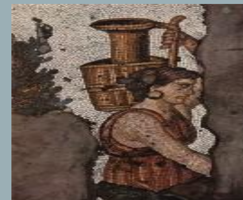
Византийская мозаика (V в.)