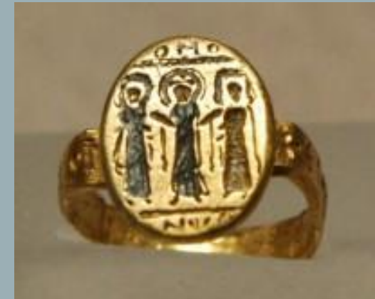
Обручальное кольцо, чёрное золото (Византия)