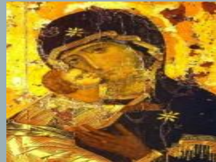
Владимирская икона Божией Матери (начало XII в., Константинополь)

На Русь икона попала из Византии в начале XII в. в качестве подарка святому князю Мстиславу от патриарха Константинопольского Луки Хрисоверга. Сначала Владимирская икона находилась в женском Богородичном монастыре Вышгорода (недалеко от Киева). Сын Юрия Долгорукого святой Андрей Боголюбский в 1155 г. принес икону во Владимир (поэтому она и получила своё наименование). Хранилась в Успенском соборе. Во время нашествия Тамерлана в 1395 г. чтимая икона была перенесена в Москву для защиты города от завоевателя. На месте «сретения» (встречи) москвичами Владимирской иконы был основан Сретенский монастырь, давший название улице Сретенке. Войска Тамерлана без видимых причин повернули от Ельца обратно, не дойдя до Москвы, по заступничеству Богородицы. В монументальной живописи Византии большое распространение получила мозаика .