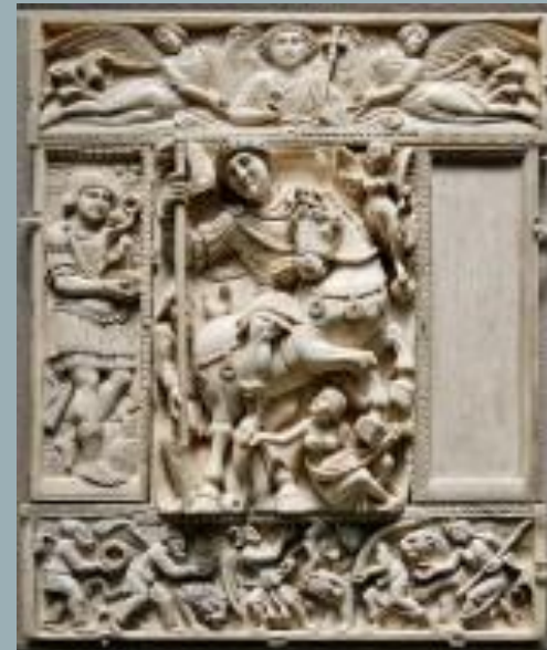
Диптих Барберини (V-VI вв.)