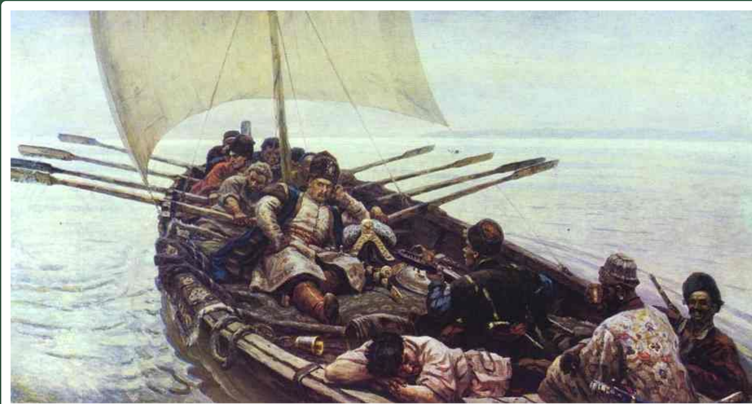
В.И.Суриков «Степан Разин»