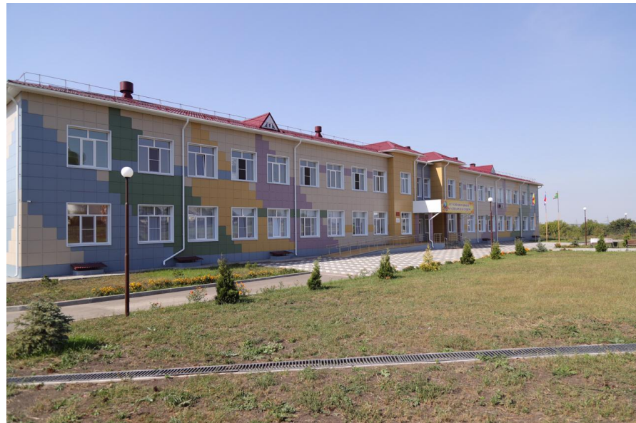
Школа на 132 учащихся в с. Незнаново Кораблинского района Рязанской области