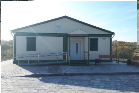
«ФАП в с. Токарево Касимовского района»