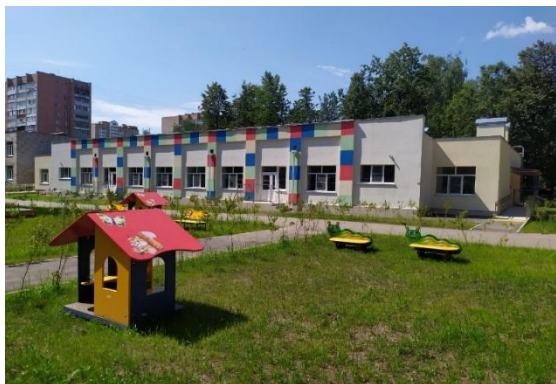
Пристройка к зданию МБДОУ «Детский сад №22» г. Рязани