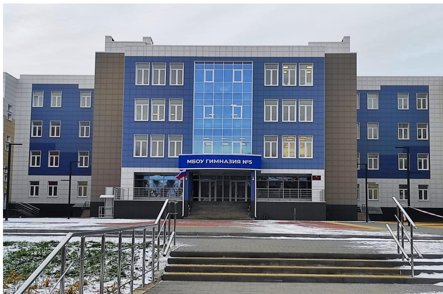
Общеобразовательная школа на 1100 мест в микрорайоне Горроца