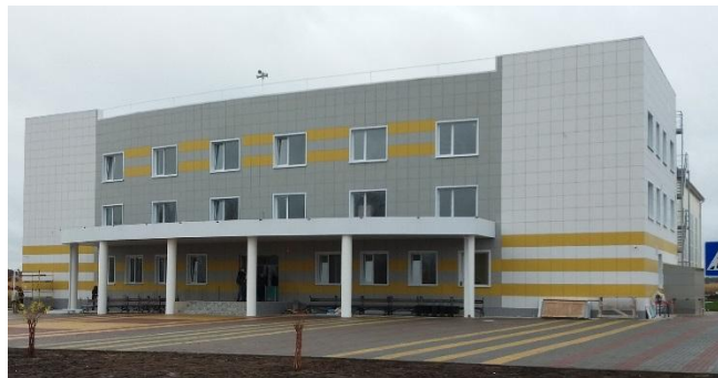
Физкультурно-оздоровительный комплекс в р.п. Старожилово Рязанской области