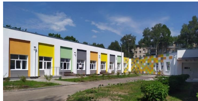
Пристройка к зданию МБДОУ «Детский сад №108» г. Рязани