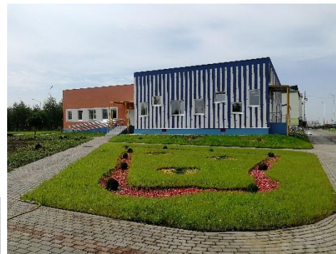
Здание дошкольной образовательной организации на 60 мест по адресу: Рыбновский район, г. Рыбное