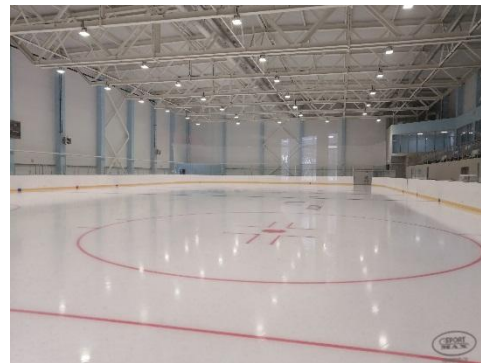
Крытый каток по ул. Шевченко г. Рязани