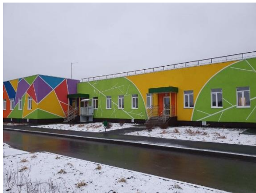
Здание дошкольной образовательной организации на 60 мест по адресу: Рязанский район, пос. Мурмино