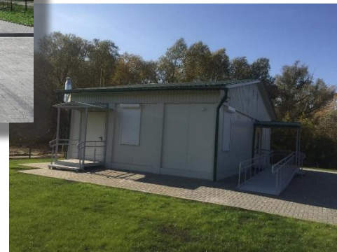
«ФАП в с. Черная Слобода Шацкого района»