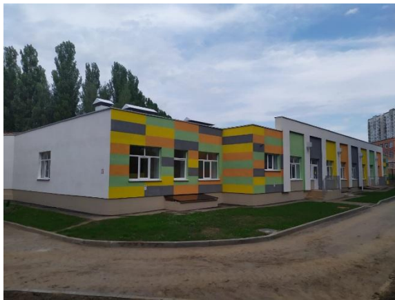
Пристройка к зданию МБДОУ «Детский сад №125» г. Рязани