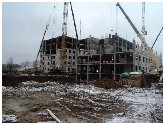
Главный лечебный корпус областного онкологического диспансера