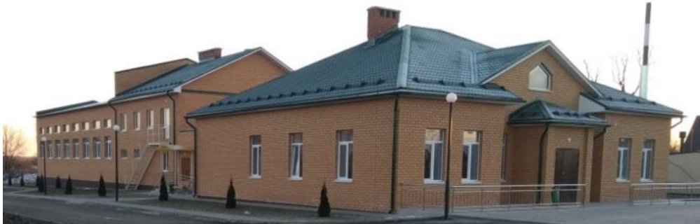
Клуб на 80 мест со спортзалом в с. Кипчаково Кораблинского района

- Клуб на 80 мест со спортзалом в с. Кипчаково Кораблинского района