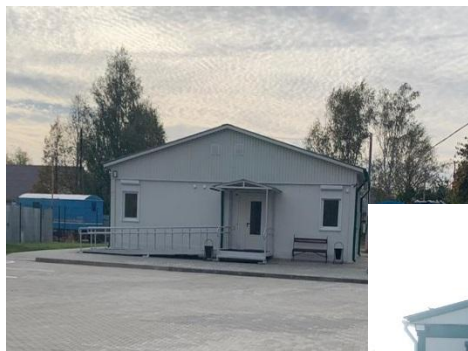
«ФАП в с. Кипчаково Кораблинского района»