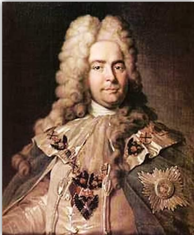
ПАВЕЛ ИВАНОВИЧ ЯГУЖИНСКИЙ

Одновременно с Сенатом появилась должность фискалов . Обязанность обер-фискала при Сенате и фискалов в провинциях состояла в негласном надзоре за деятельностью учреждений: выявляли случаи нарушения указов и злоупотреблений и доносили Сенату и царю. С 1722 года контроль над Сенатом осуществляют генерал-прокурор и обер-прокурор, которым подчинялись прокуроры всех других учреждений.