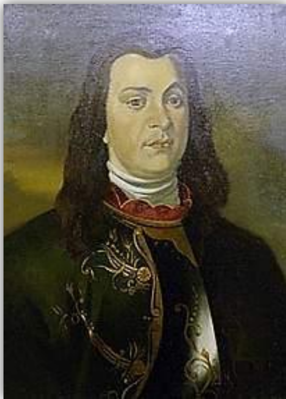
АНТОН МАНУИЛОВИЧ ДЕВИЕР – первый генерал- полицмейстер Санкт-Петербурга