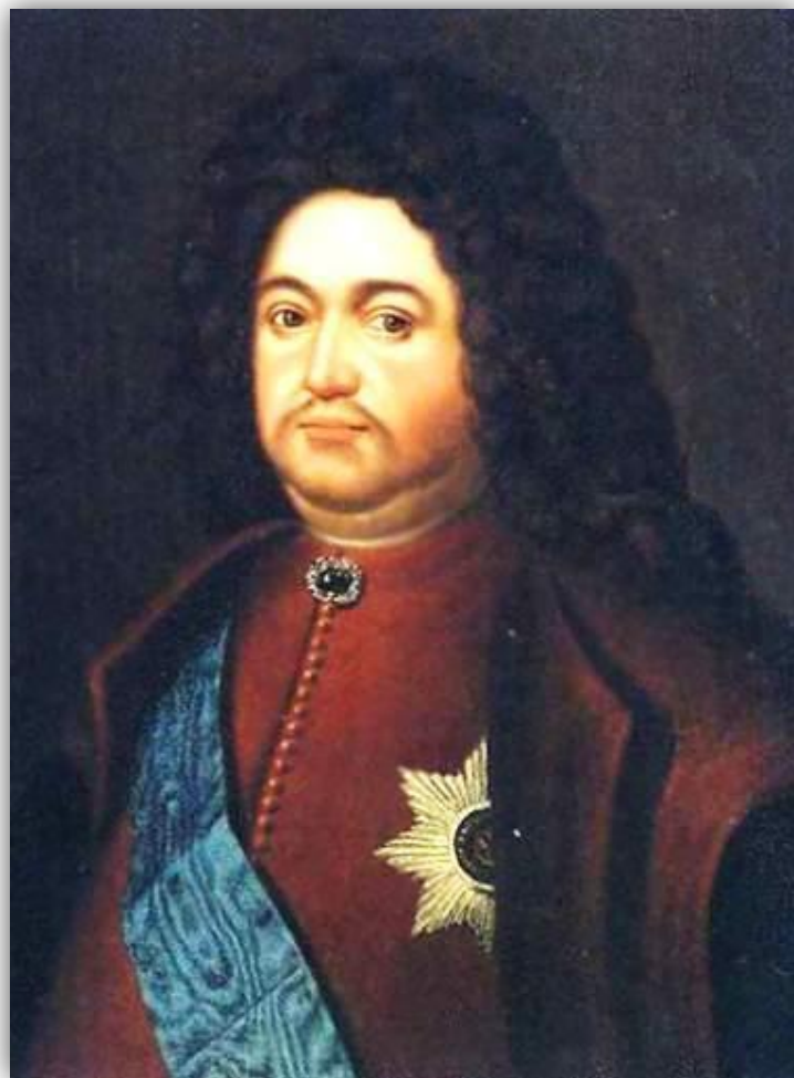
БОЯРИН ТИХОН НИКИТИЧ СТРЕШНЕВ

В состав Сената царь назначил 9 человек боярской знати и своих выдвигенцев. Решения принимались коллегиально. Он превратился в постоянно действующее высшее правительственное учреждение, что было закреплено Указом 1722 года :