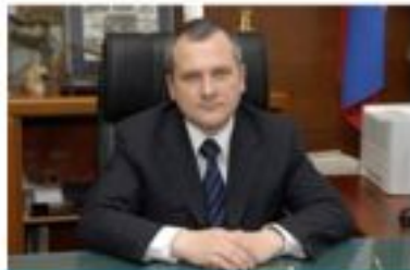
Директор будівельної компанії