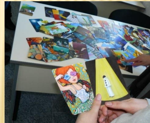
Робота з асоціативними картками