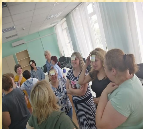
Групова рольова гра