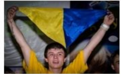
Лідер молодіжного руху