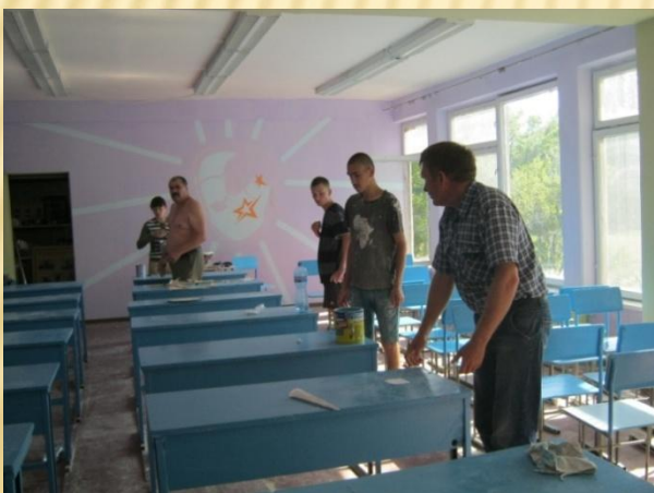
Ремонтні роботи в аудиторіях