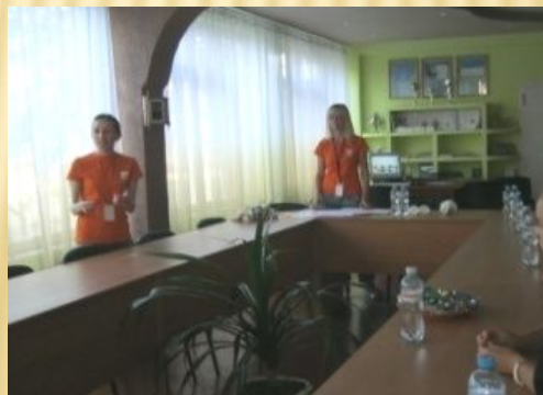
Зустріч з партнерами