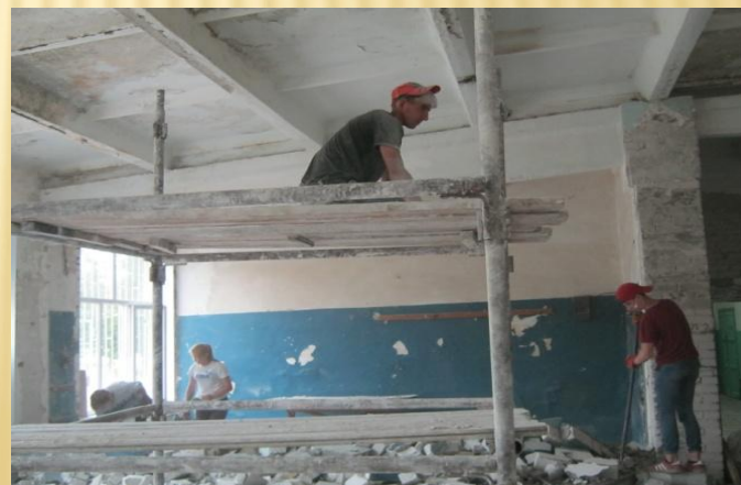
Роботи на підприємствах портнерів Сєверодонецький домобудівельний комбінат