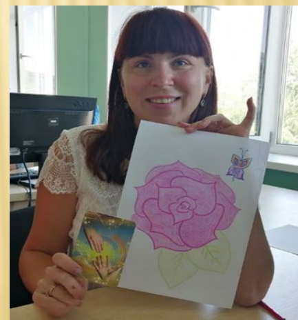
Арт-терапія з асоціативними картками