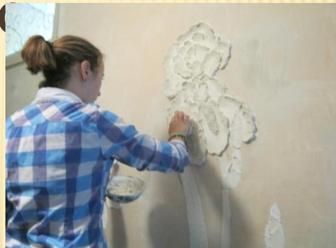
Благодійні творчі роботи по оздобленню приміщень