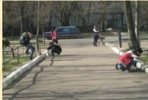
Акція «Чисте довкілля»