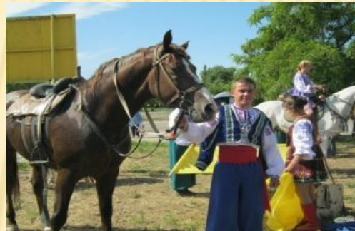
Відвідування міських заходів