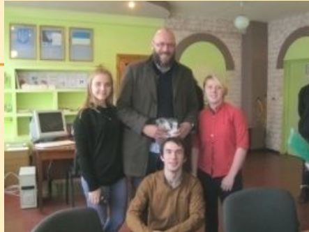
Зустріч з партнерами