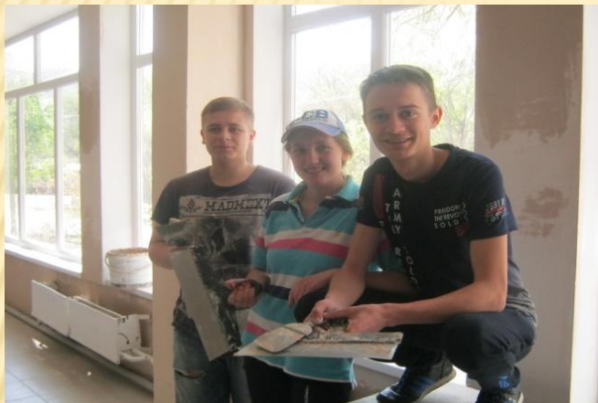
Внутрішні ремонтні роботи в ліцеї