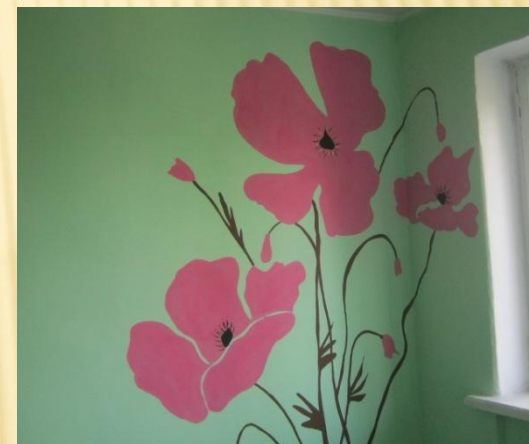
Ремонтні роботи в гуртожитку