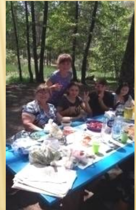
Свято Івана Купала