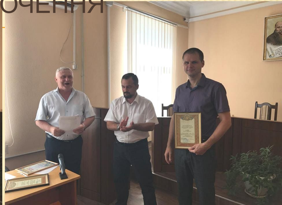
Нагородження грамотами майстрів директором концерну.