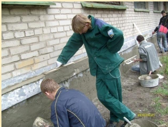
Зовнішні ремонтні роботи в ліцеї