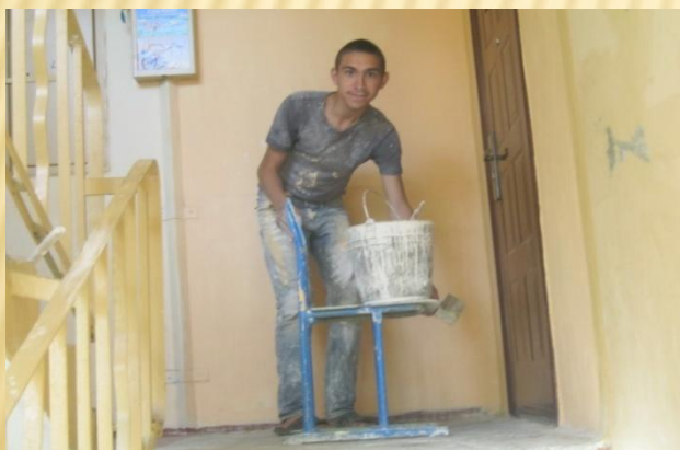
Роботи на підприємствах портнерів «ДоброБУТ»