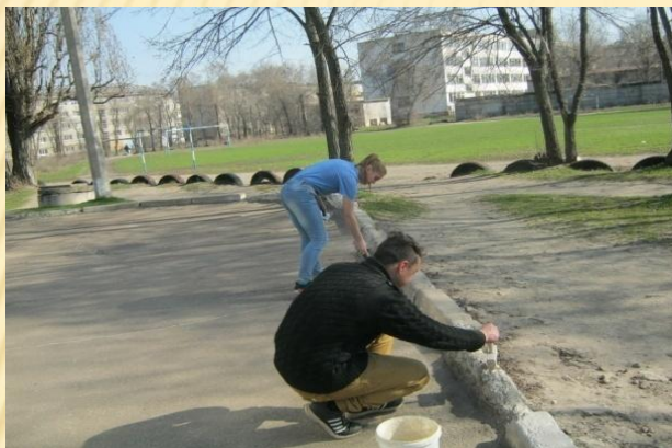
Роботи по благоустрою