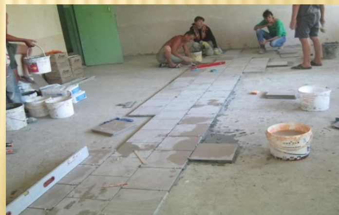
Ремонтні роботи в майстернях