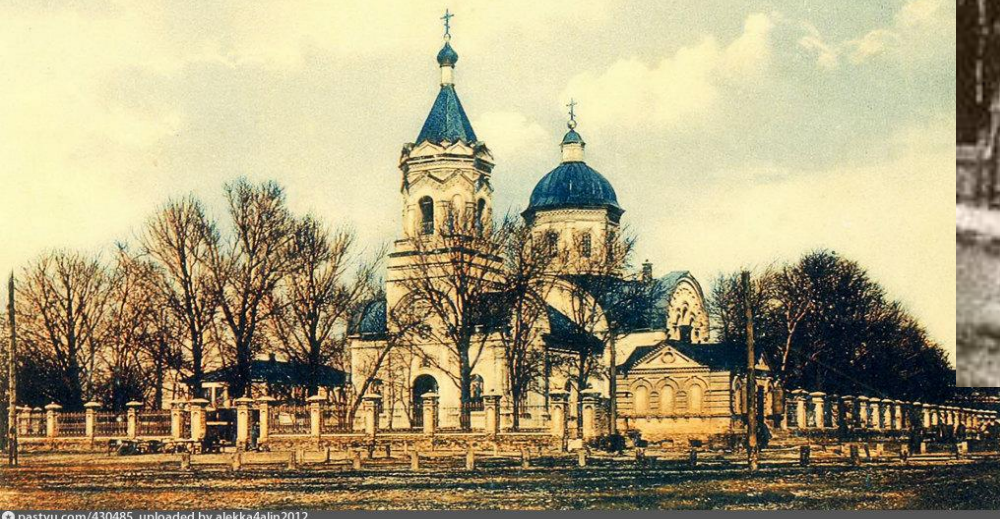
Екатеринославъ. Покровская Церковь