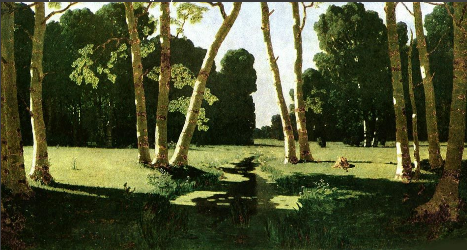
А. Куинджи «Березовая роща»