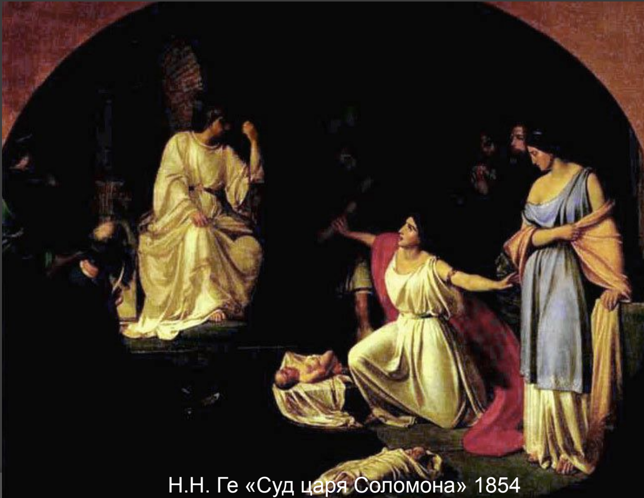
И.И. Ге «Суд царя Соломона» 1854