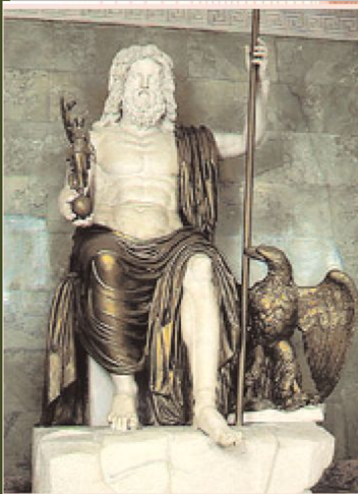
Зевс. Древняя статуя

Общий характер курса отражен в названии и содержании тем: «Возникновение религий. Религии мира и их основатели», «Священные книги религий мира», «Искусство в религиозной культуре», «История религий в России», «Религия и мораль. Нравственные заповеди в религиях мира». Курс знакомит с историей зарождения религий мира, их базовыми принципами, их священными книгами и культурными традициями, что содействует воспитанию у школьников веротерпимости и расширению их культурного горизонта.