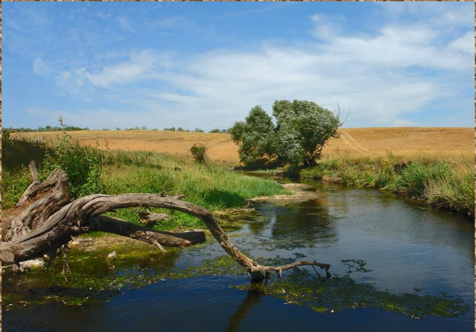
Сучасний вигляд річки Кальчик (Донецька область)