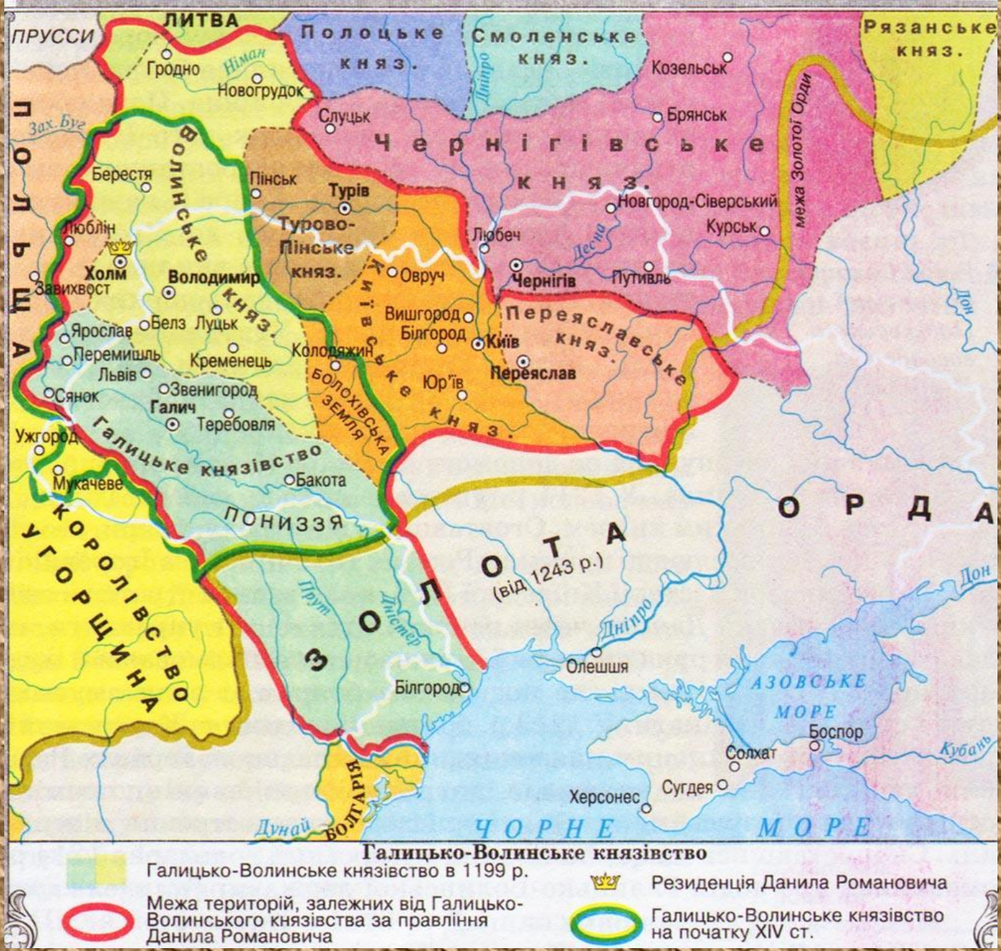
Галицько-Волинське князівство (кінець ХІІст.) 3