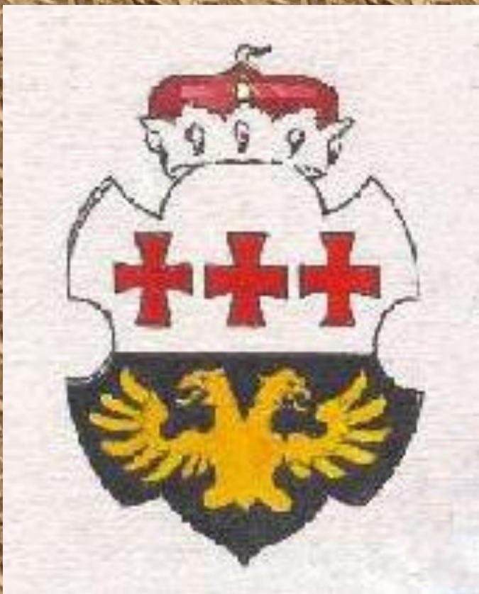
Герб Червоної Русі 1555 р. Nürnberg (репринт München, 1882).

Червона Русь — історична назва Галичини, вживана в писемних джерелах, переважно польських, у XVI — XVIII століттях для визначення колишнього Галицького князівства