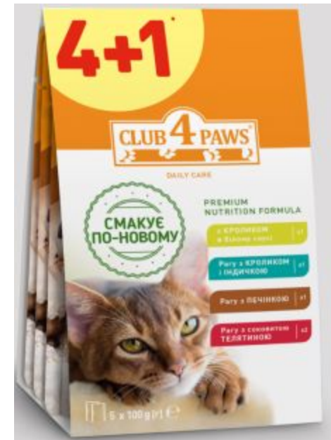
Асорті (Клуб Коти з кроликом в білому соусі , Клуб Коти з кроликом та індичкою ,Клуб Коти з печінкою Клуб Коти з телятиною 2 шт.)