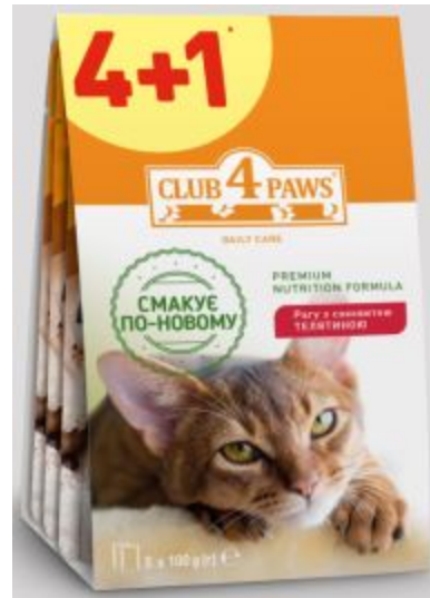
Клуб Коти паучі з телятиною