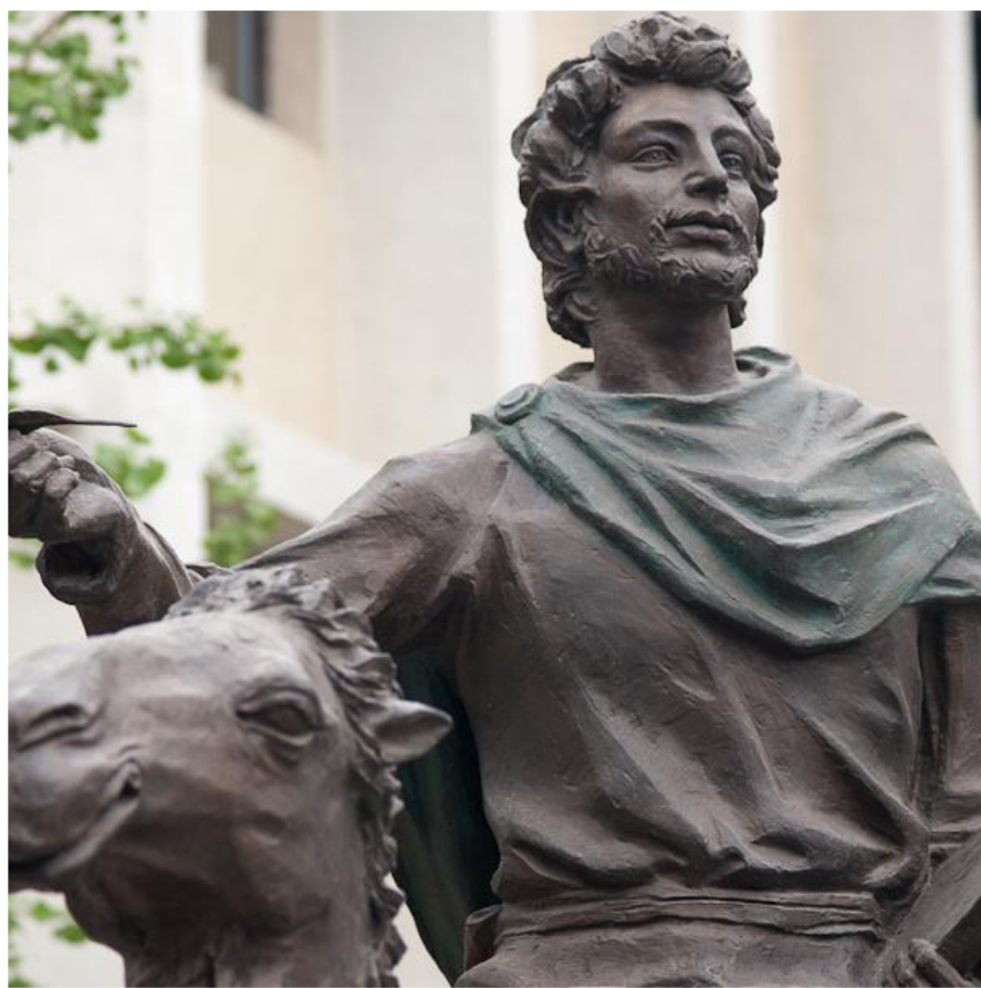
ПАМЯТНИК МАРКУ ПОЛО.