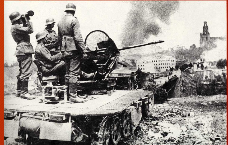
Второй период войны