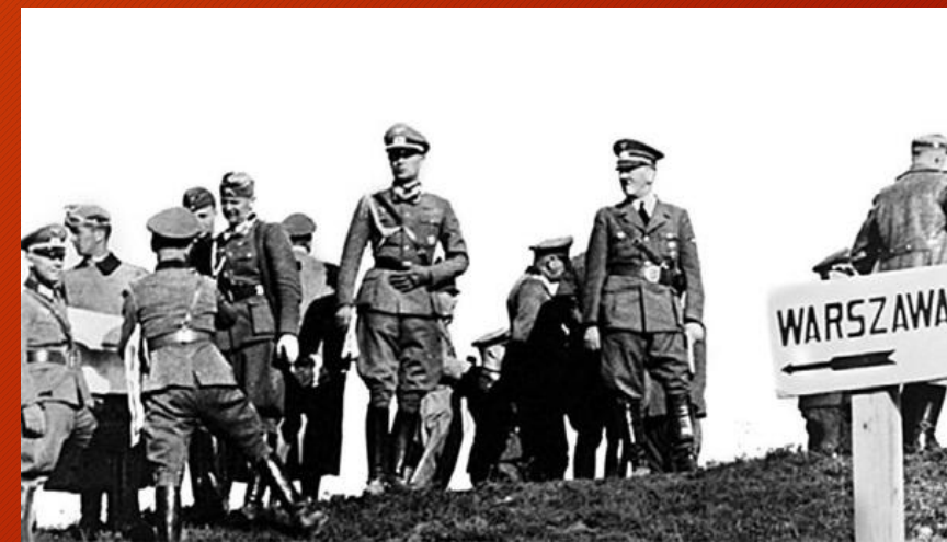
Первый период войны