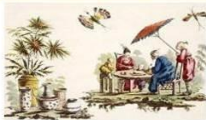
Фарфор, складной зонтик, шёлк.