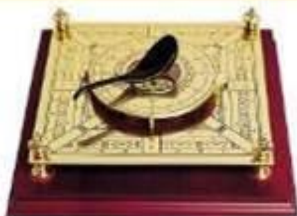
Модель китайского компаса