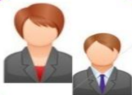
Вышестоящие, проверяющие и другие органы образования