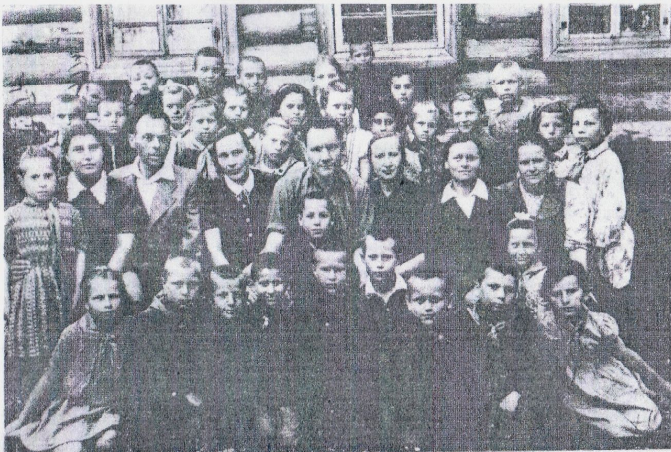
(На фото: воспитанники Дебесско-литовского детдома 1942-1944гг.)