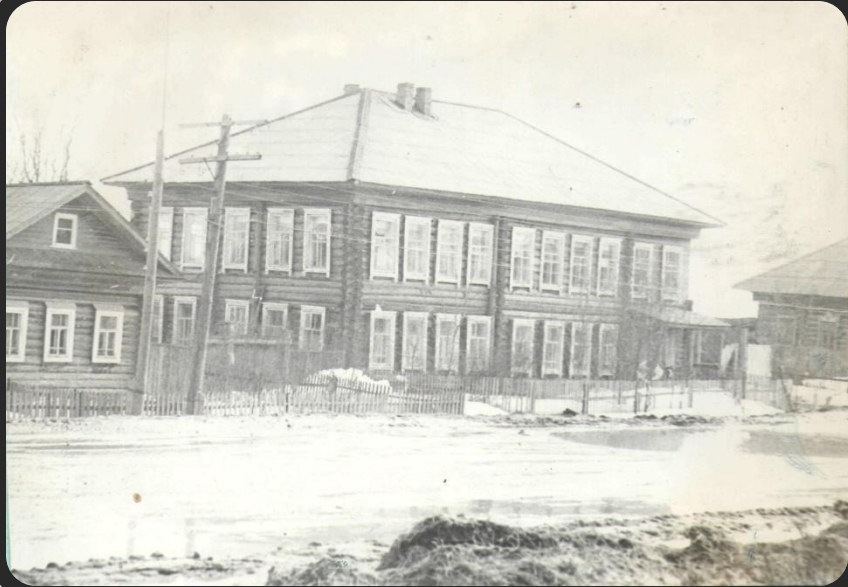
Один из корпусов педучилища, в котором литовцы учились