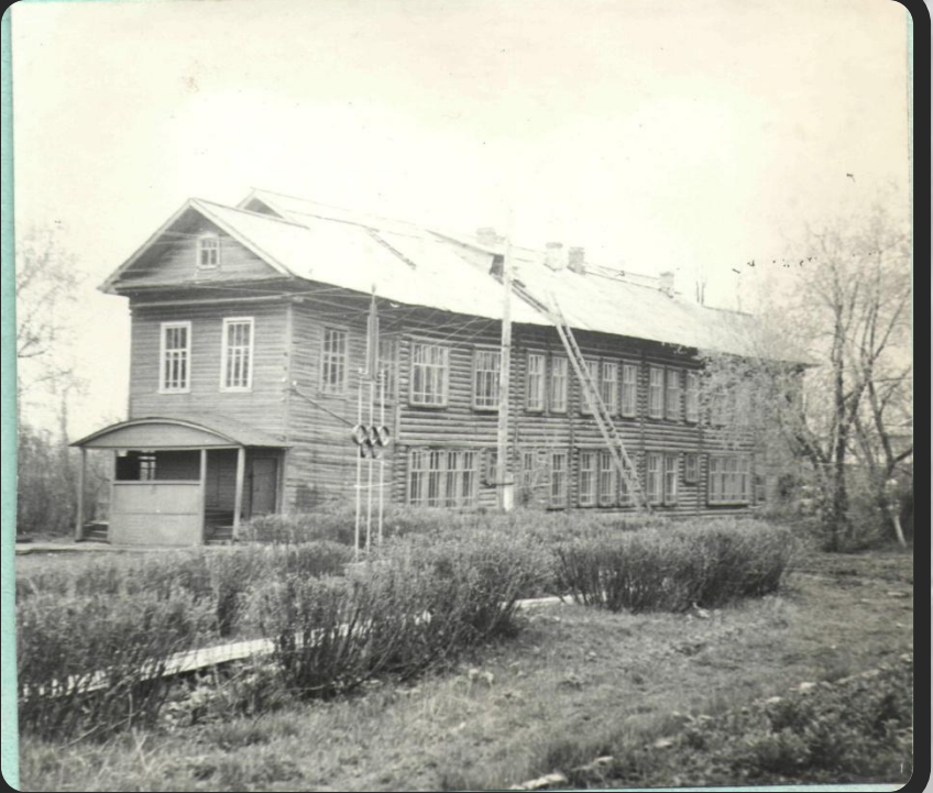
Корпус общежития в котором жили литовские дети