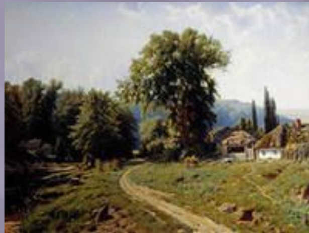
Хутір в Малоросії