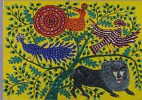
Художні образи М.Приймаченко