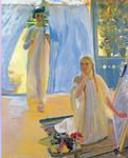
XX століття Євангеліє в образах